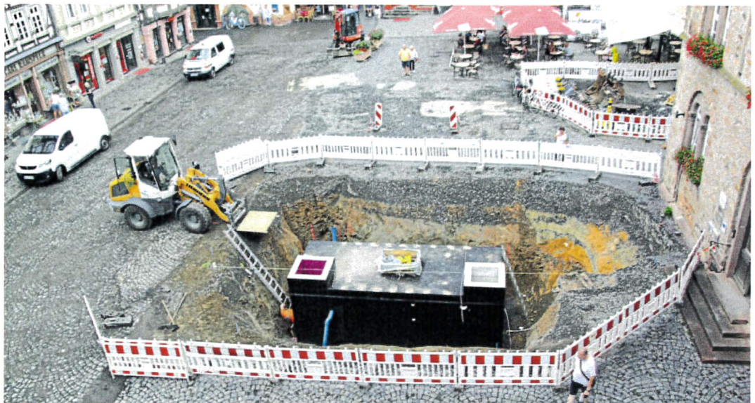
Bauarbeiten für die Wasserspiele auf dem Marktplatz: Der schwarze Betonkasten enthält den Wassertank und die Pumptechnik, um die Wasserspiele zu versorgen. Sie werden hinter der Baugrube im aktuell noch geschotterten Bereich installiert.

Vogelsbergkreis (pm). Über das Wochenende sind beim Gesundheitsamt fünf positive Corona-Ergebnisse eingegangen. Zurückzuführen sind die fünf neuen Fälle auf den Ausbruch in einem Nachbarlandkreis. Die Betroffenen aus dem nördlichen Kreisgebiet befinden sich in häuslicher Quarantäne, einige zeigen leichte Symptome, einige sind symptomfrei.