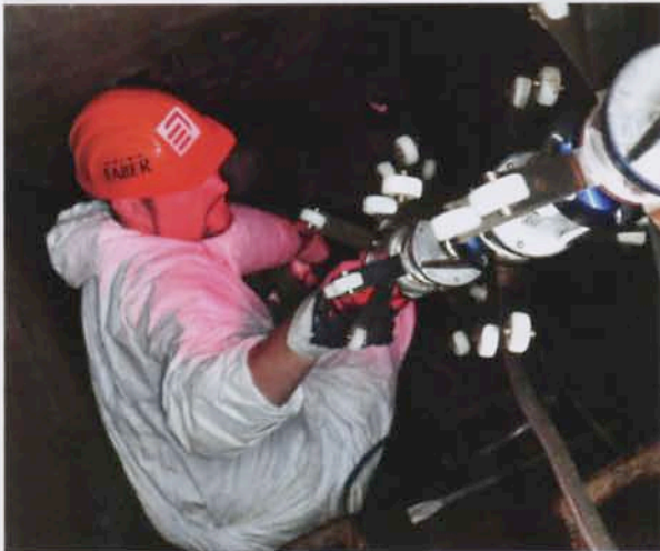
Lichterkette zum Aushärten der GFK-Liner mit UV-Licht.

Bemerkenswert war auch, dass sich der Netzbestand im Zuge der Sanierung immer wieder veränderte. An einige Anschlussleitungen kam man nur über eine Baugrube heran; per Leitungsortung wurde zuvor ermittelt, wo die Gruben zu errichten waren. In diesen Gruben fanden sich fallweise weitere, in den Plänen nicht verzeichnete Leit-