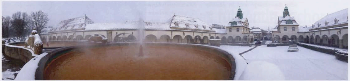
Jugendstil-Baudenkmal mit sanierungsbedürftiger Infrastruktur: der Sprudelhof im Herzen Bad Nauheims.