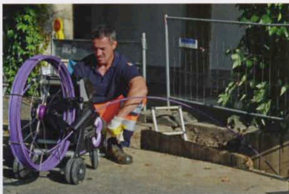
Noch während der Sanierungsarbeiten mussten immer wieder neu entdeckte Leitungen geortet und per TV-Kamera untersucht werden.