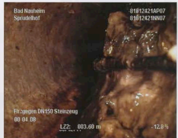
Problemfall: von mineralischen Inkrustationen verstopftes Abwasserrohr vor ...

Bereits vorhandene Funktionseinschränkungen beseitigen und der Neubildung von Ablagerungen vorbeugen – das war die Aufgabenstellung des Sanierungskonzeptes für die Sprudelhof-Kanäle, das von dem auf Kanalsanierungskonzepten spezialisierten Ingenieurbüro Ohlsen GmbH, Grünberg, ausgearbeitet und im November 2012 bzw. im Juli 2013 durch die Niederlassung Landsberg der Swietelsky-Faber Kanalsanierung GmbH realisiert wurde. Auftraggeber war das Hessi-