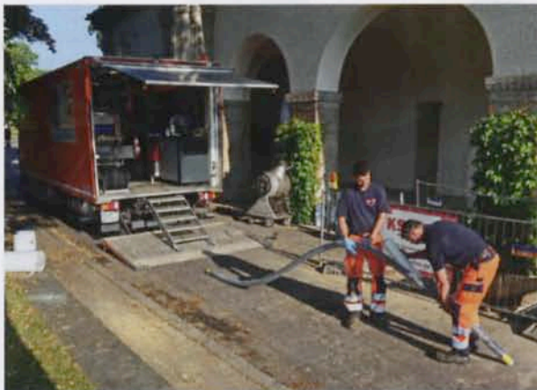
Vorbereitung des Packers für einen Longliner-Einbau in einen Hausanschluss.