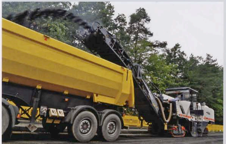
BILD 4: „High Tech“ auch oberirdisch: Dieser Prototyp einer Asphaltfräse von Wirtgen, auf der Licher Straße im Testeinsatz, fräst ganze Fahrbahnen von 2,10 m Breite auf einmal ab