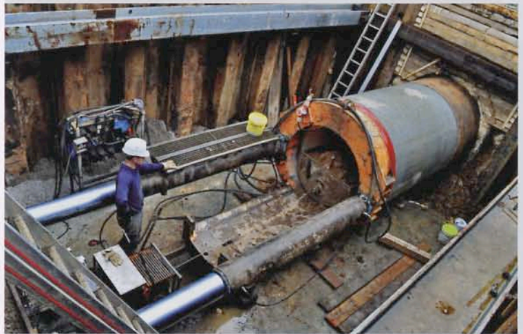
BILD 3: Das in Gießen eingesetzte Schildvortriebs-Aggregat der Herrenknecht AG kann bis zu 616 Tonnen pressen