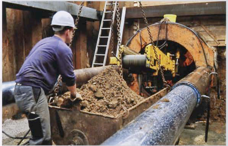
BILD 2: Das an der Ortsbrust abgebaute Erdreich wurde per Fließband kontinuierlich nach hinten gefördert

Nach dem DWA-Arbeitsblatt 125 für Rohrvortrieb und verwandte Verfahren wird das in Gießen eingesetzte nicht steuerbare Verfahren als „offenes Schildverfahren mit teilflächigem Abbau mit Teilstützung“ bezeichnet. Zum Einsatz kam eine Teilschnittmaschine der Herrenknecht AG. Dabei wurde innerhalb des Schneidrohres der Boden mit einer Baggerschaufel abgebaut, über ein Förderband nach hinten in die Baugrube abgeführt und in regelmäßigen Abständen per Lkw abgefahren. In den entstehenden Stollen schob die hydraulische Presse nach und nach die jeweils 7 t schweren und 2 m langen Einzelelemente des Betontunnels ein. Die beiden mächtigen, ölhydraulischen Teleskop-Stempel des Geräts können eine Last bis maximal 616 t pressen. Der an der Ortsbrust abgebaute Boden wurde durch den stetig anwachsenden Stahlbetontunnel laufend weiter entfernt. Für eine präzise axiale Ausrichtung des Bauvorgangs sorgte unterdessen ein Baulaser. Der bautechnische „Kraftakt“ dauerte nach Einrichtung der Baugruben – insgesamt fünf Arbeitstage.